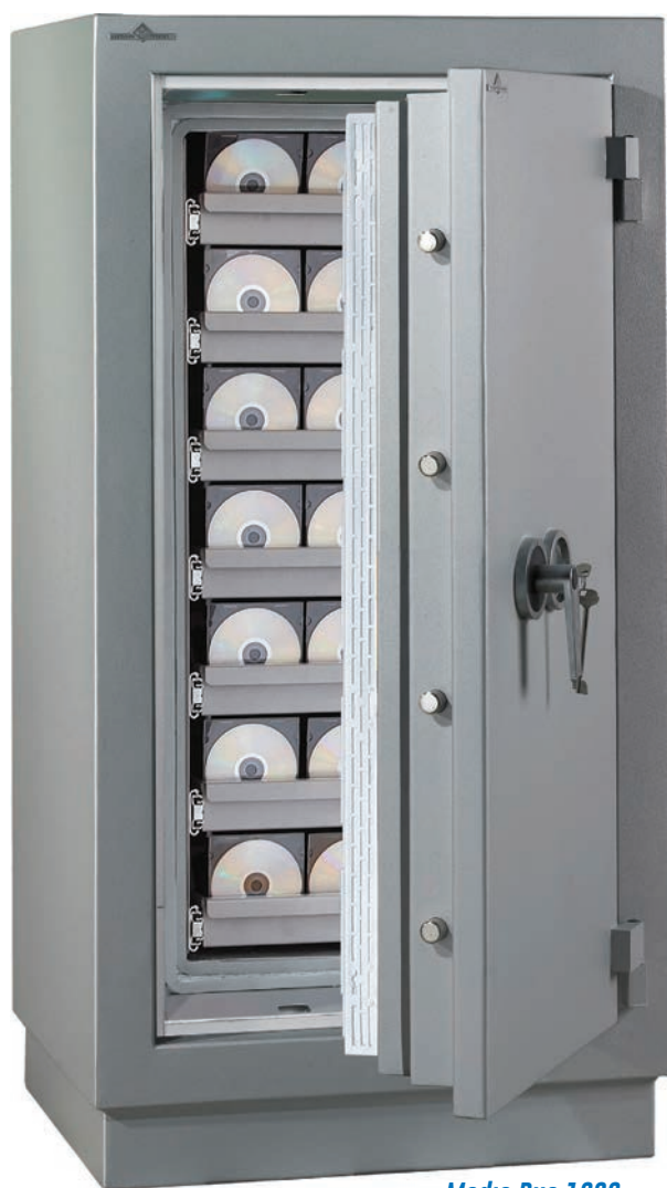
Media Duo 1280.

Valeur assurable : 25 000 €Classe 1 ou 35000 €Classe 2.